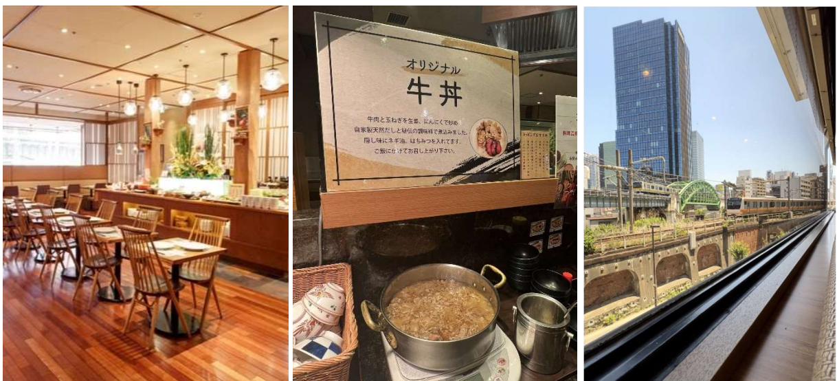
写真：(左) 朝食会場「あけびの実」 (中央) 自慢の手作り牛丼 (右) 窓側席からの風景

“朝タン”とは、朝からタンパク質を摂取すること。代謝が良くなったり、筋肉が付きやすくなったりすると言われていています。当館の朝食バイキング「あけびの実」では、これまでのビジネスホテルの朝食の域を超えた豊富なメニューの数々をご用意しています。人気の「特性スープカレー」は、ゴロゴロ野菜を柔らかくなるまで煮込み、そのままでも十分美味しいですが、仕上げにスパイスを調合して自分好みにカスタマイズすることができます。そして2024年、新たに加わったのが「オリジナル牛丼」。牛肉と玉ねぎを生姜とニンニクで炒め、自家製天然だしと秘伝の調味料で煮込み、隠し味にネギ油とはちみつを入れています。脂っぽさがなく朝からもりもり食べられる様に作ったこだわりの逸品です。また、すぐ目の前を走る電車を間近で見ながら食事を楽しめるのも都心ならではの“おもてなし”の心を込めてお作りする自慢の朝食で、元気いっぱい1日のスタートをお迎えください。朝食のみのご利用も可能です。※料理内容は季節や入荷状況により変更する事がございます。