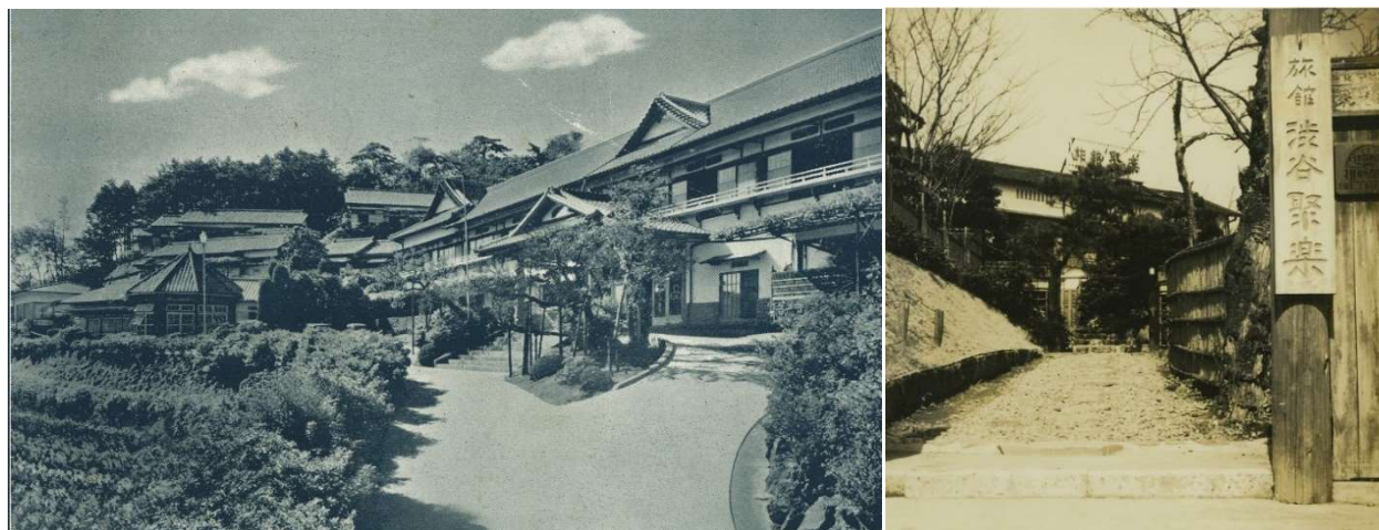
写真：(左) 1947 (昭和 22) 年 6 月 伊東かにや聚楽開業。場所は現在の伊東ホテルジュラク (右) 1947 (昭和 22) 年 9 月 旅館渋谷聚楽開業。1960 年代からはスポーツ合宿などの利用が多かった (1995 年 8 月まで営業)

その後も、本業の飲食・宿泊事業以外にも積極的に新規事業を手掛けていき、復興と同時進行で拡張の道を突き進んでいきます。